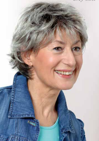
Ilona Mono SF Grey-Root