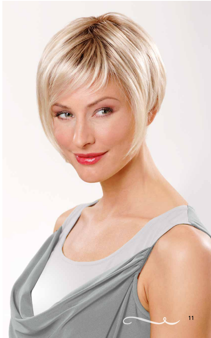
Vicky Mono SF Champagne-Mix-Root

Ein Großteil der Belle/Madame Perücken ist mit der Super-Front (SF) ausgestattet.