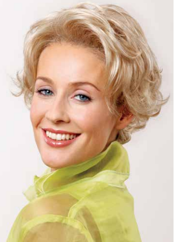
Mirja Mono SF Terracotta-Gold