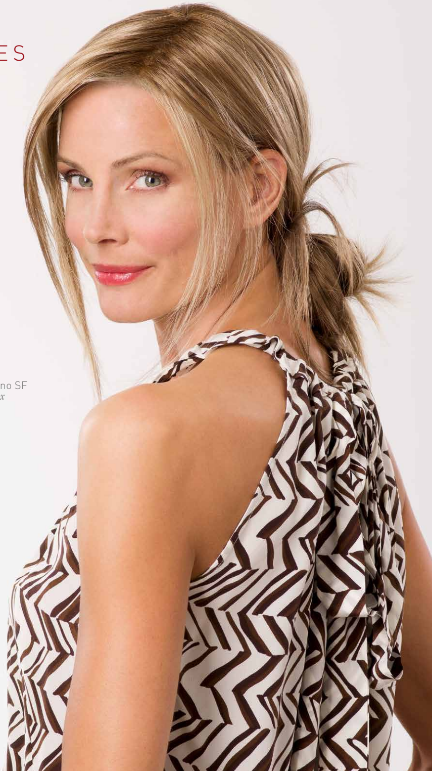
Lola Mono SF Honey-Mix

Das Monofilament ist eine hauchdünne Gaze mit Einzelhaarverknüpfung, welche extrem leicht und luftdurchlässig ist.